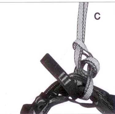
Sopra: ■ In senso orario: figura 1a, figura 1b e figura 2. ■ Figura 3.